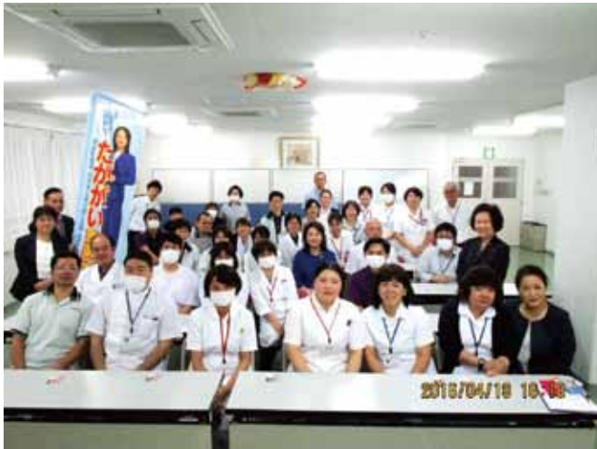
大島郡医師会病院